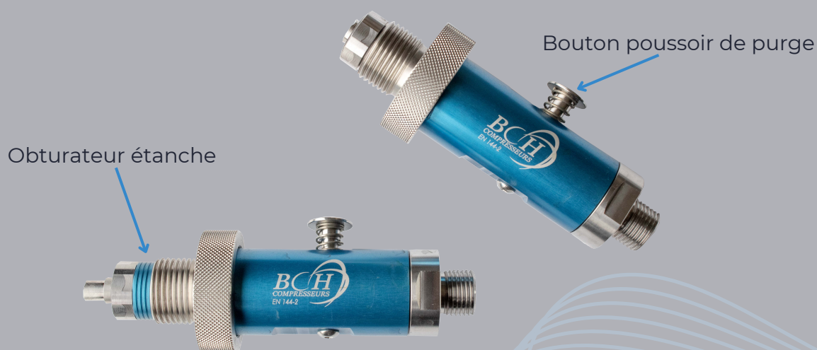
Connecteur sécurisé BCH Compresseurs EN 200 bar / EN 300 bar

La conception unique du connecteur BCH n'impose pas que tous les flexibles soient raccordés à une bouteille pour démarrer un cycle de remplissage. Un obturateur étanche empêche tout transfert d'air et de pression vers l'extérieur.